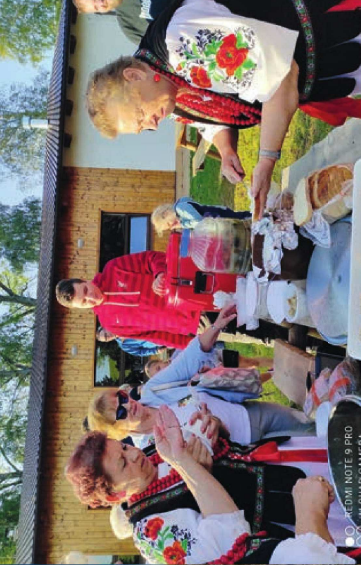
„Požegnanie wakacji“ (5.09.2021) – Zespół ludowy Kola Gospodyń Wiejskich „Wolborzanki” z Wolborza k. Nowej Rudy / „Rozloučení s prázdninami” (5. 9. 2021) – Lidový soubor Kroužku vesnických hospodyň „Wolborzanki” z Wolborze u Nowé Rudy