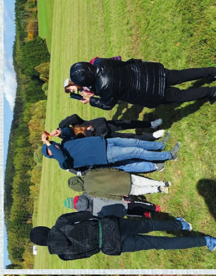
„Obáz fotograficzny” (22-23.10.2021) / Fotografický kemp” (22-23. 10. 2021)