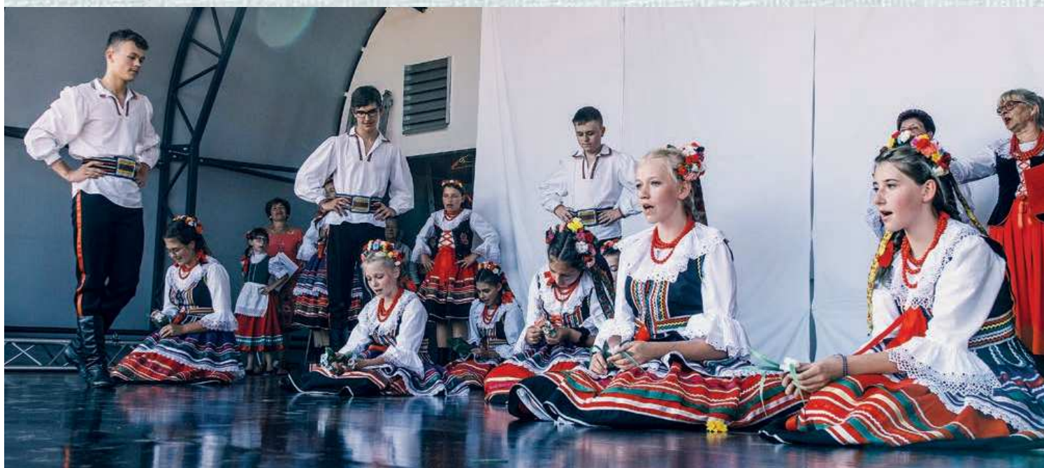
Zespół folklorystyczny „KWIATUSZKI LNU” z Chelmska Śląskiego / Folklorní soubor „Květy lnu” z Chelmska Śląského