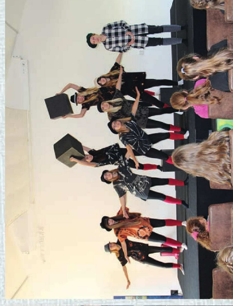
„Przedstawienia teatralne” (3.10.2021) – Grupy Teatralne „I MORELE” i „I MORELE bęc” z Czarnego Boru „Divadelní představení” (3. 10. 2021) – Divadelní soubory „I MORELE” a „I MORELE bęc” z Czarného Boru