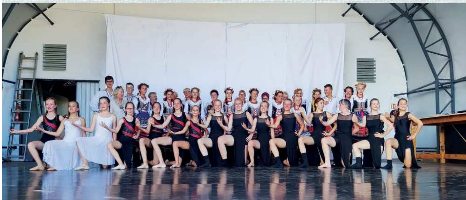
„Taneczne wystapienia szkól” / „Taneční vystoupení škol” (12. 8. 2021)

Účast na akcích organizovaných hlavníím partnerem BCB Broumov v Janovickách