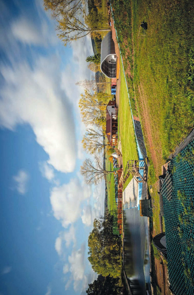
BCB Koupálo Janovičky